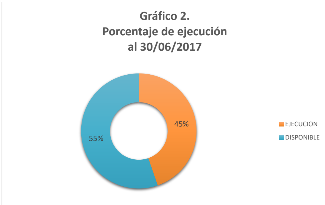
Gráfico 2. Porcentaje de ejecución total y disponible.